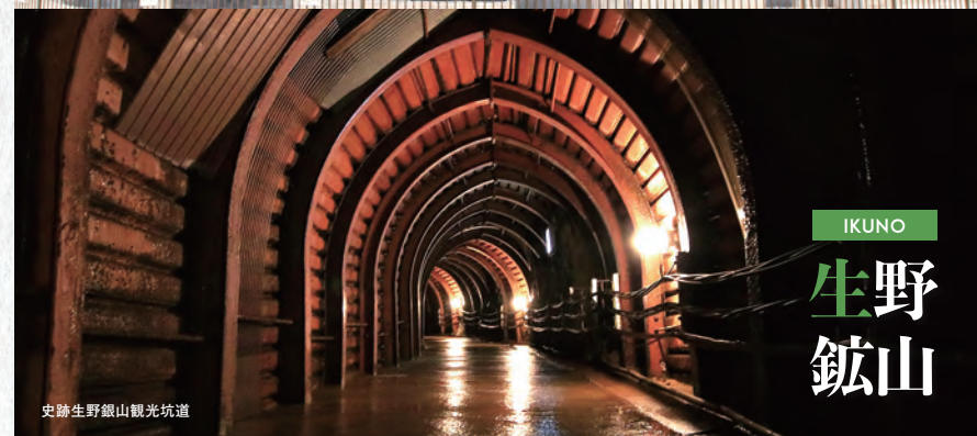
史跡生野銀山観光坑道