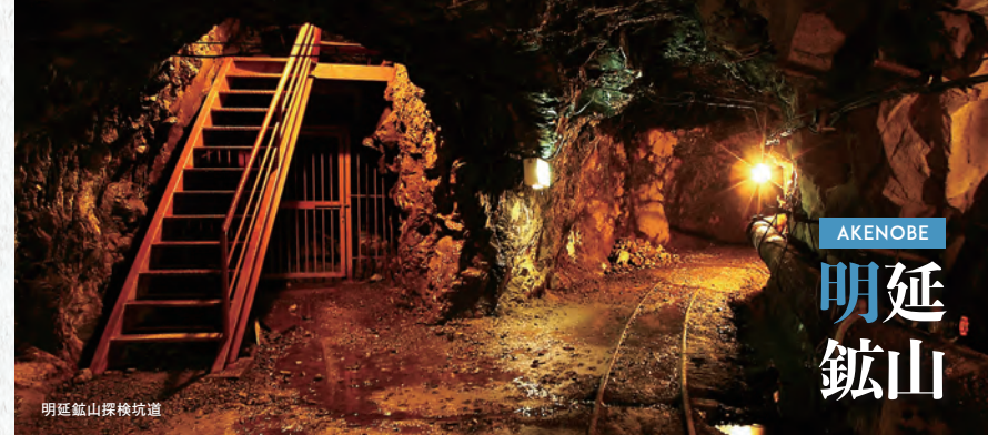
明延鉱山探検坑道

◆無料(20名まで) ※入場料別途必要 ◆約1時間～1時間30分(問・予約)シルバー生野 079-679-2010