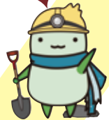
養父市イメージキャラクター「やっぶー」

明治から昭和にかけて日本の近代化を支えた明延鉱山(兵庫県養父市)、神子畑鉱山、生野鉱山(兵庫県朝来市)。明治維新後、日本初の官営鉱山となり、国家プロジェクトとして世界の最新技術が数多く導入された近代化産業遺産だ。 これらの鉱山エリアは現在、「鉱石の道」と名付けられ、当時を偲ぶ貴重な鉱山遺産をはじめ、鉱山町の景観・歴史・文化等を実際に見て歩くことができる。 また各エリアに鉱石の道関連グッズがたくさんあるので、チェックしてぜひおみやげに買って帰ろう。