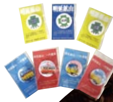
明延鉱山探検坑道