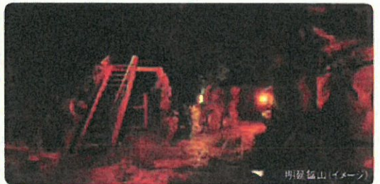
明延鉱山(イメージ)

明延鉱山 日本一の錫の鉱山として栄えました。探検坑道ではむき出しの岩肌や地面、削岩機など、当時のままの姿を見学することができます。