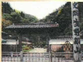
生野銀山(イメージ)

東洋一の選鉱場。山の斜面をいかした約20階建の高さの巨大コンクリートは偉大な歴史の建造物。一度はみていただきたい圧巻の選鉱場跡です。