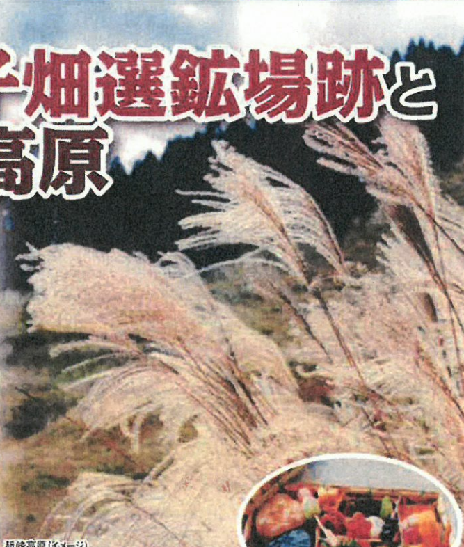
砥峰高原(イメージ)