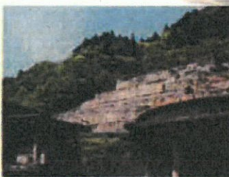
神子畑選鉱場跡(イメージ)